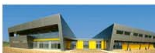
A cég új üzemcsarnoka Perbálon