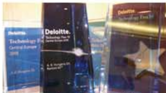
Az elnyert Deloitte-díjak